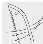
Machete afilado, listo para cortar